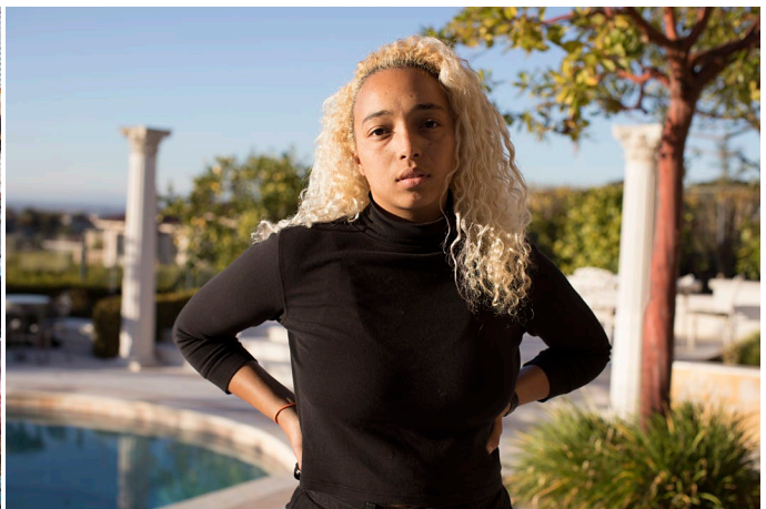
Figure 7. Home Away From Home / Adam (2017). Series of 26 pigment inkjet prints on Canson photo satin premium paper, 55 x 37 cm.

and photographs: Home Away from Home / Adam (2017) [Figure 7].