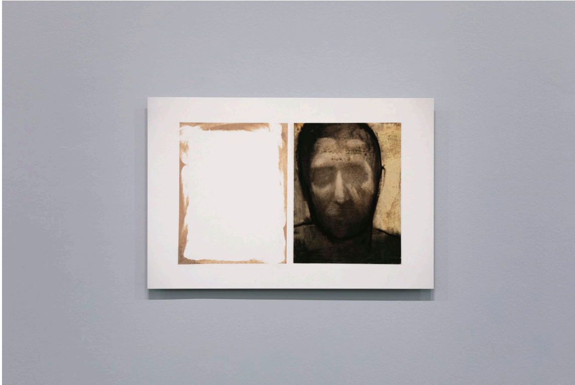
Figure 2. Undefined (1997). Oil on paper, tape, 49 x 78,5 cm. View of the exhibition at MACVAL, 2021.