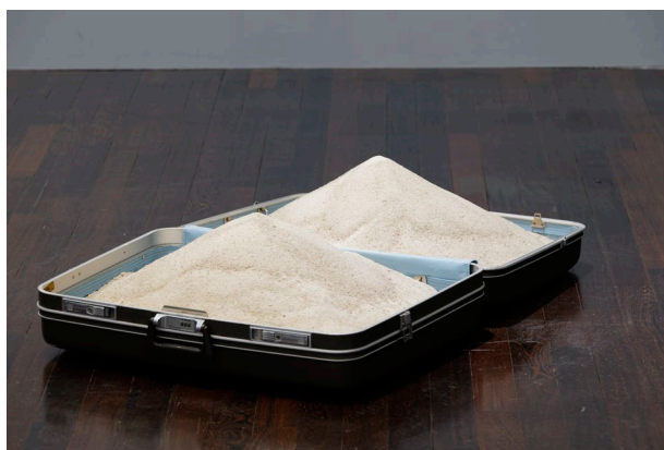
Figure 1. Untitled (1998). Suitcase, sand, variable dimensions. View of the exhibition at MACVAL, 2021.

Aujourd'hui, j'ai vécu autant d'années en Palestine qu'en France. C'est la raison pour laquelle j'ai tenu à réactualiser l'œuvre Sans titre (1998) [Figure 1], l'assemblage d'objets présentant une valise remplie de sable. Au lieu de former un seul tas, dans un seul pan de la valise, j'ai