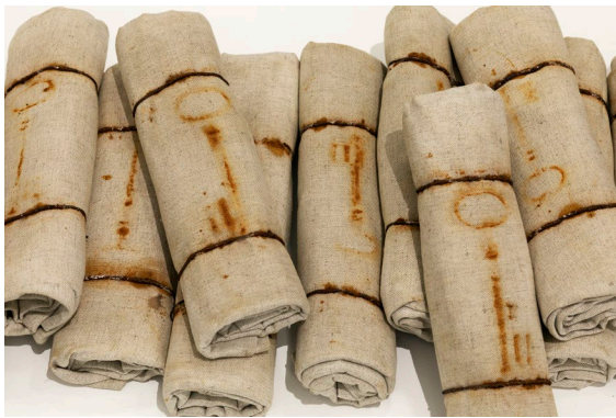
Figure 3. Untitled, detail (1997). Keys imprints on rolled canvas, 20 elements 30 cm each, View in detail of the exhibition at MACVAL, 2021.

TB: Yes, it is important to me that my work avoids any victimization, any pathos, any strictly political discourse. To this end, all means are good: fiction, detour... I try to use "filters" to keep a distance.