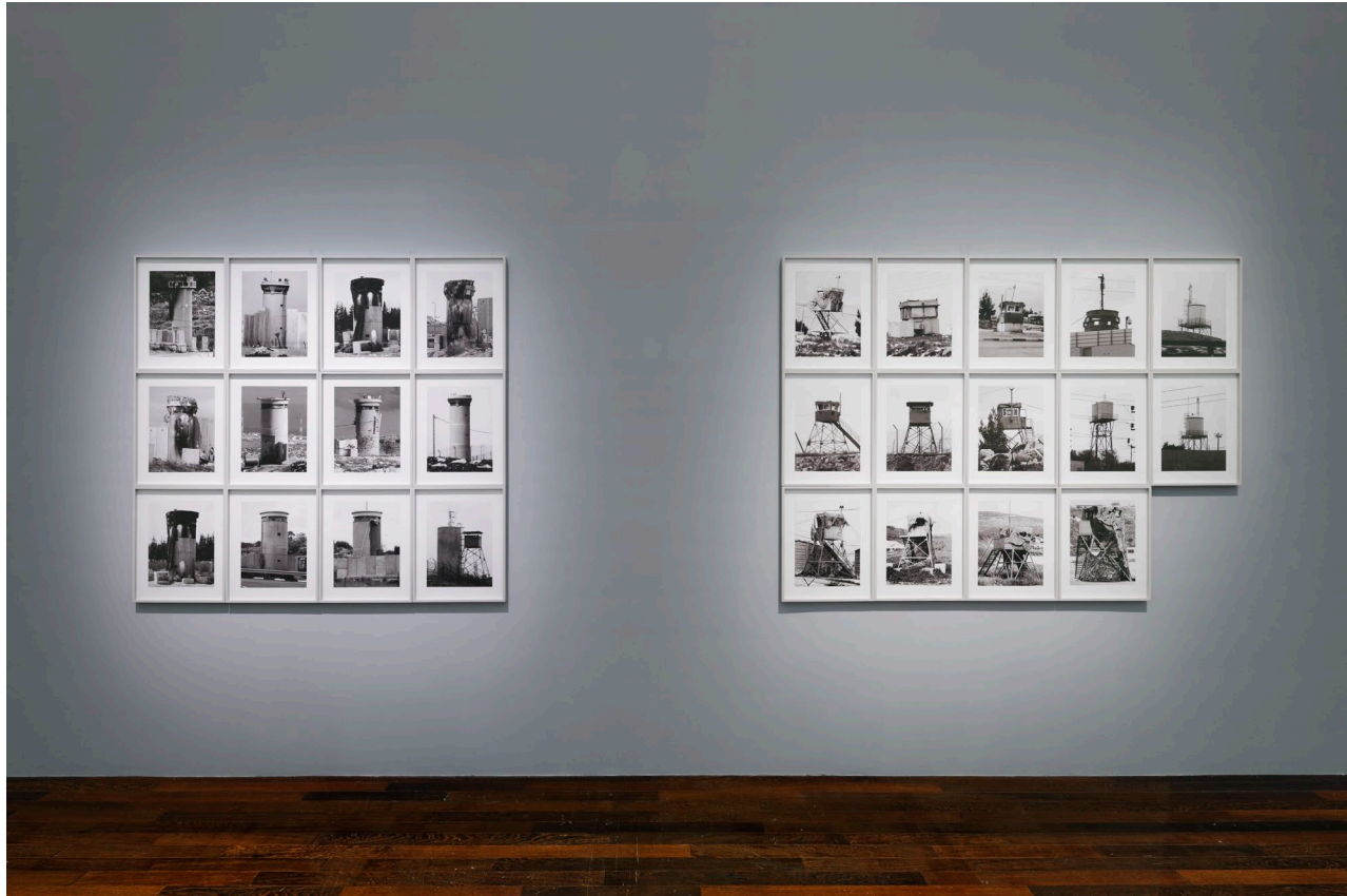
Figure 5. Watchtowers (2008). Series of 26 photographs, black and white digital prints, 40 x 50 cm. View of the exhibition at MACVAL, 2021.

Other people put me in touch with Israeli photographers who were willing to do this work, but I wanted it to be seen from the Palestinian side. Even if my first idea was to do as the Bechers did, to work with a camera, to take the time... We quickly realized that installing this type of equipment in a guarded military zone, moreover without accreditation, was impossible. The delegated photographer had to work with a normal digital camera equipped with a telephoto lens to take pictures from a distance. Sometimes, he took the picture while passing in a bus or in a car, or even hidden behind a tree... As a result, contrary to the perfect images of the Bechers, who follow the protocol to the letter, the photographs of Watchtowers are sometimes blurred, pixelated, in backlight, etc. Because it was impossible to take the time to pose. What seemed to be flaws eventually became an advantage, because the goal was not to imitate the Bechers identically. It was just enough to create the illusion from a distance. At first glance, one thinks that this is one of their series, but a second time, one realizes that it is not. The precariousness of the photos, their defects, indirectly evoke the situation. Without making a speech on what is a watchtower, on the complexity of the displacement, one feels all this tension which surrounds it, the difficulty, the danger to approach it.