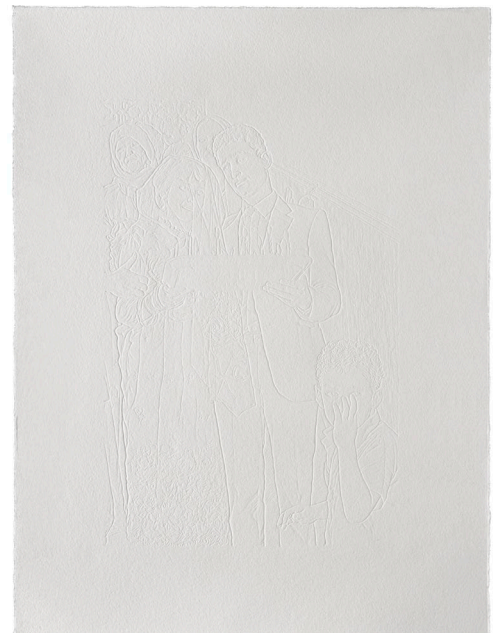
Figure 6. To my brother (2012). Series of 60 hand carvings from photographs on paper, 30.5 x 40.5 cm. Detail (right) and view of the exhibition at MACVAL, 2021.