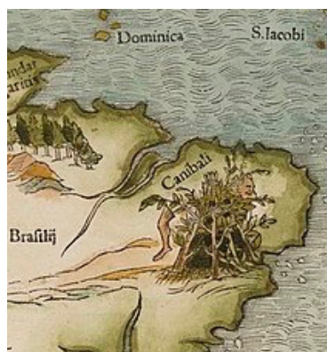
Figure 2b: Sebastian Münster, Novae insvlae XXVI nova tabvla , [1545 -1552?]. (Détail).

Il est vrai que le terme est aussi appliqué dès 1544 à des Noirs africains 11 , mais le même Sébastien Münster, dans sa Totius Africæ tabula, & descriptio uniuersalis (1554) réputée être la première carte moderne du continent africain, n'y représente qu'un seul être à figure humaine, certes monstrueux, puisqu'il s'agit d'une sorte de cyclope géant, le « Monoculi » de la tradition, mais blanc 12 . En image du moins, le cannibalisme reste associé au Nouveau Monde, image à