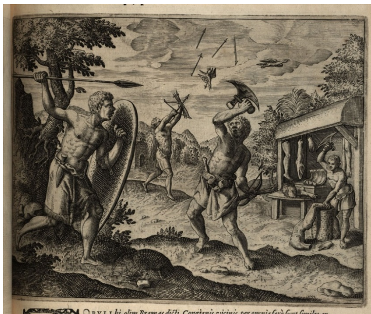
Figure 5 : Théodore de Bry, Planche XII, dans India orientalis. Pars I, Regnum Congo hoc est vera descriptio regni africani, quod tam ab incolis quam lusitanis congas appellatur. per Philippum Pigafettam, olim ex Edoardi Lopez acroamatis lingua italica excerpta , Frankfurt, Wolfgang Richter, 1598. https://bodmerlab.unige.ch/recits-et-images/debry/#/petits-voyages/PVI

Cette scène est illustrée dans la planche XII, la seule des quatorze planches du volume montrant une scène cannibale.