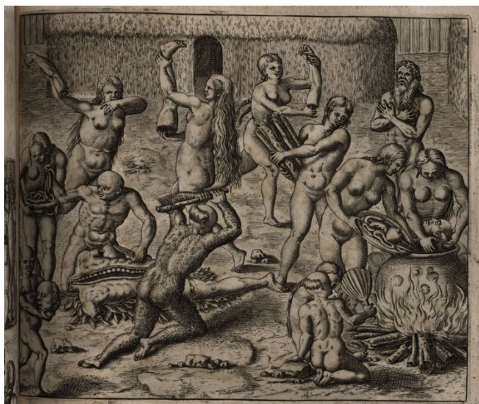
Figure 4 : Théodore de Bry, India occidentalis. Pars III, Americae Tertia Pars , 1592. https://bodmerlab.unige.ch/recits-et-images/debry/#/grands-voyages/GVIII