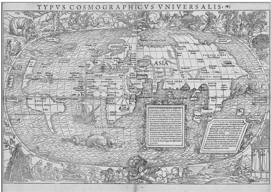
Figure 1a: Sebastian Münster, Typus Cosmographicus Universalis , 1532. https://commons.wikimedia.org/wiki/File:1532_map_of_the_world_by_Sebastian_M%C3%BCnster.jpg