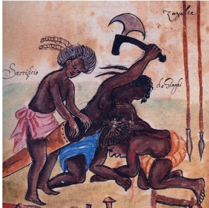
Figure 6a: Giovanni Antonio Cavazzi, XII, dans Enzo Bassani, Un cappuccino nell'Africa des Seicento. I disegni des Manoscritti Araldi del Padre Giovanni Antonio Cavazzi da Montecuccolo , Milano, Quaderni Poro 4, Carlo Monzino, 1987, p. 44 (détail).