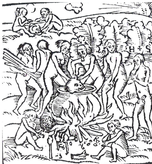
Figure 3 : Gravure sur bois de Staden, 1557. Hans Staden woodcut of Brazilian natives from his work "Hans Staden: The True History of his Captivity" Original Text Accompanying: Tupinamba portrayed in cannibalistic feast observed by Staden. https://commons.wikimedia.org/wiki/File:Hans_Staden_Tupinamba_portrayed_in_cannibalistic_feast.jpg

gravures sur bois originales de Staden ; la majorité a donc pour sujet les boucheries et la cuisine cannibales des Tupinambas 23 .