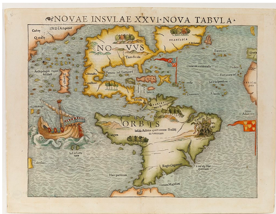
Figure 2a: Sebastian Münster, Novae insvlae XXVI nova tabvla , [1545 -1552?]. https://www.wikiwand.com/en/Cosmographia_(Sebastian_Münster)