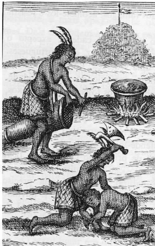
Figure 6b: Antonio Cavazzi, XII Giovanni Antonio Cavazzi, Istorica descrizione dei tre regni: Congo, Matamba ed Angola , Milan, D. Cesare Visconti, 1690, p. 194 (détail).